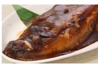
山陰沖合のかれいの煮付け