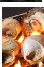
産地直送活貝焼き