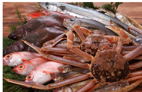
写真(上)鳥取の海の幸 (下)魚鮮水産定食(ランチ)

鳥：大山どりは、国立公園にも指定されている鳥取県の大山の麓で育ったふっくらジューシーな食感が特徴の鳥取名産の銘柄鳥です。