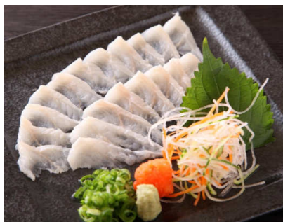
瀬戸内産 穴子の刺身