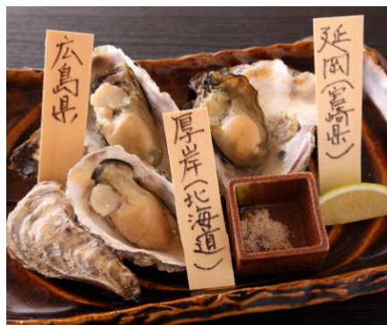
焼き牡蠣食べ比べ3種