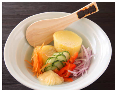
安芸津 馬鈴薯の手作りポテトサラダ