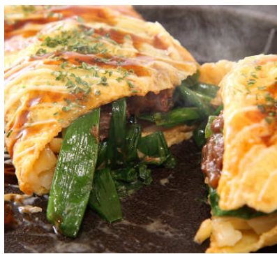
広島名物 観音ねぎ焼き