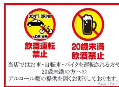
全社の取り組み 課題