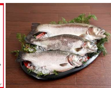
完全陸上養殖のサーモン3種