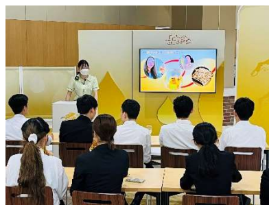
適正アルコールの研修