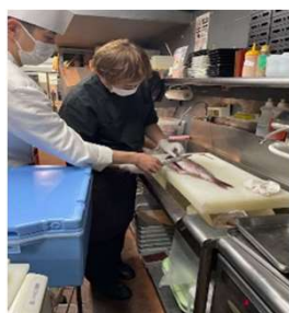
直営・FC合同調理講習会