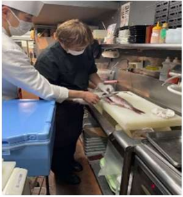
直営・FC合同調理講習会