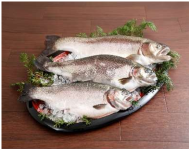
完全陸上養殖のサーモン3種