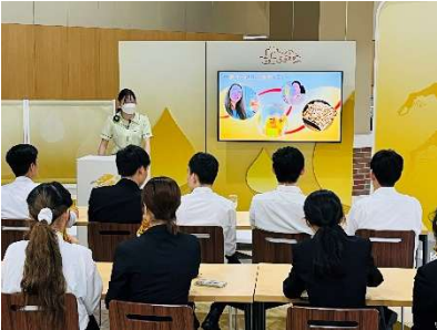
適正アルコールの研修