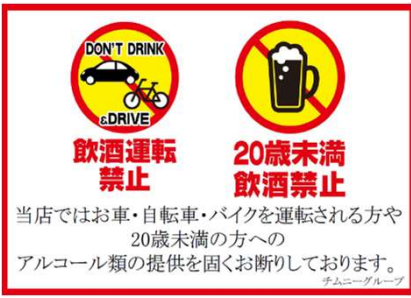
全社の取り組み 課題