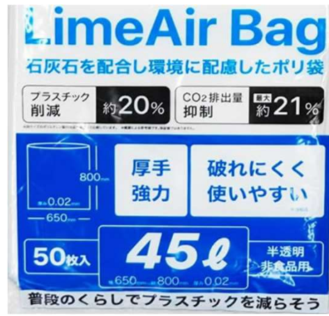
環境配慮素材使用のごみ袋