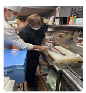
直営・FC合同調理講習会