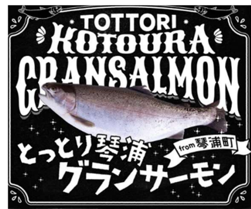
4種類目の鳥取琴浦グランサーモン