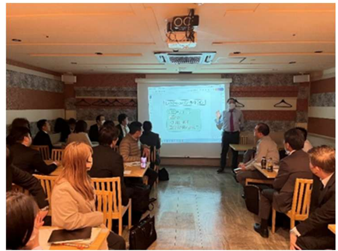
集合研修による周知徹底