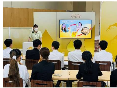
適正アルコール推奨の研修