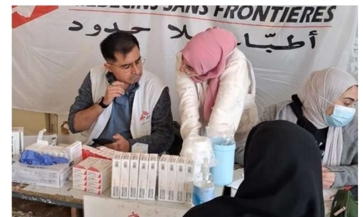
国境なき医師団